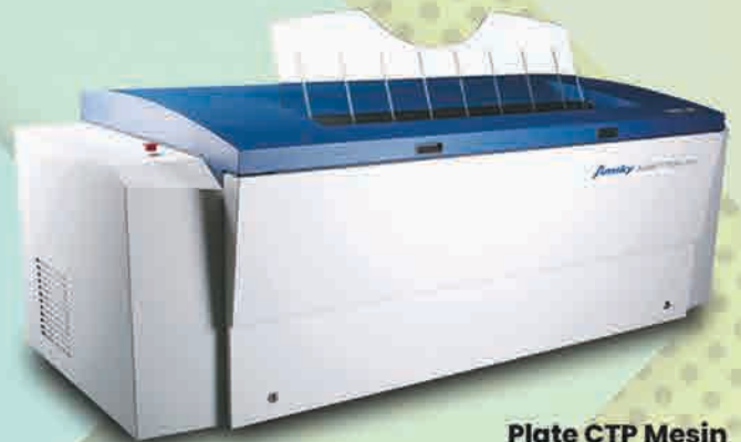
Plate CTP Mesin CTP Amsky