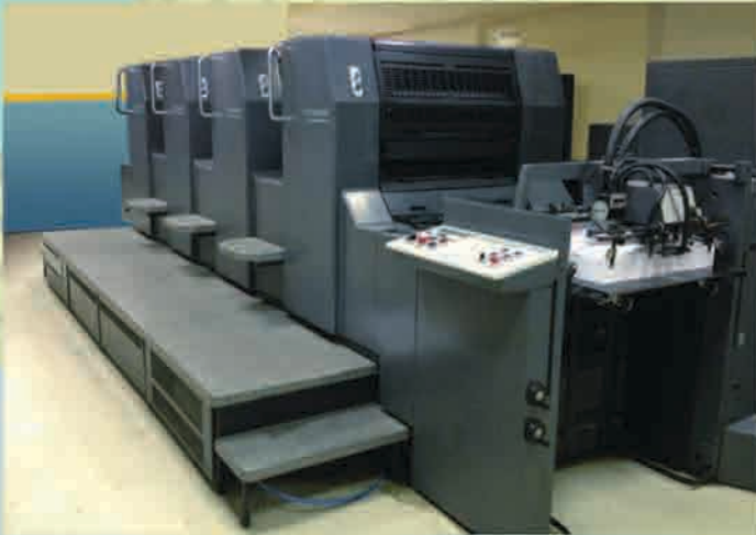
Mesin Cetak Offset Heidelberg SM 74