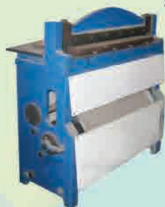
Mesin Pembolong Kertas