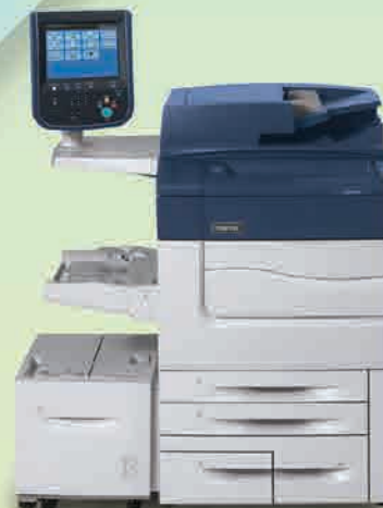
Digital Print Fuji Xerox