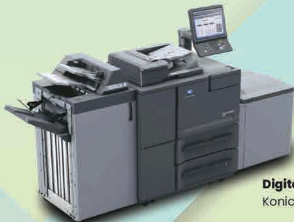
Digital Print Konica