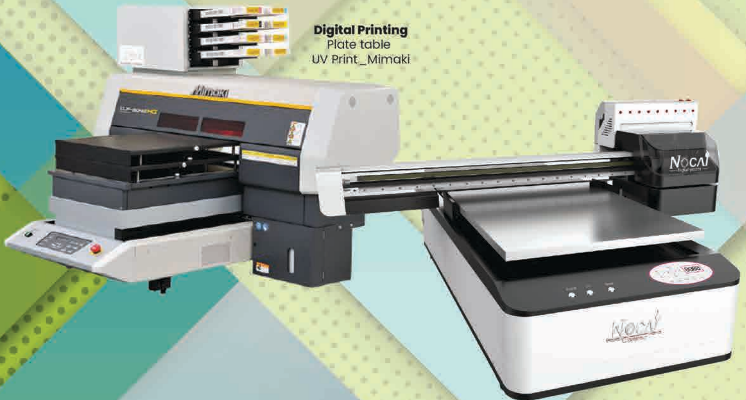
Digital Printing Plate table UV Print_Mimaki

Digital UV Printing / e Money / Id Card / Tumbler / Hotel Keys