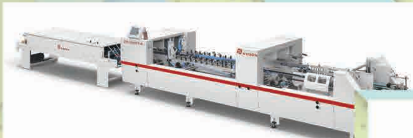
Mesin Pembuat box Makan/ Luch Box Machine