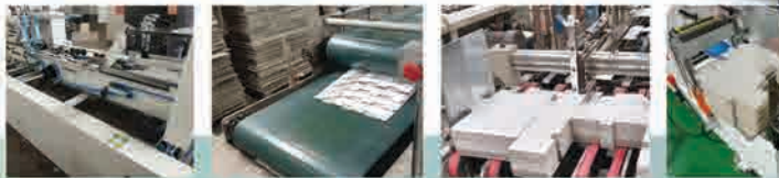
Mesin Lipat Lem / Glue & Fold Machine Merk Hoson