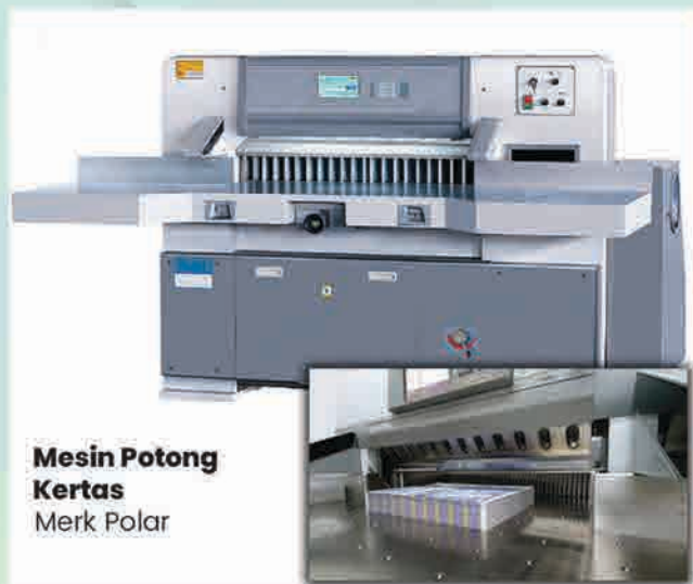
Mesin Potong Kertas Merk Polar