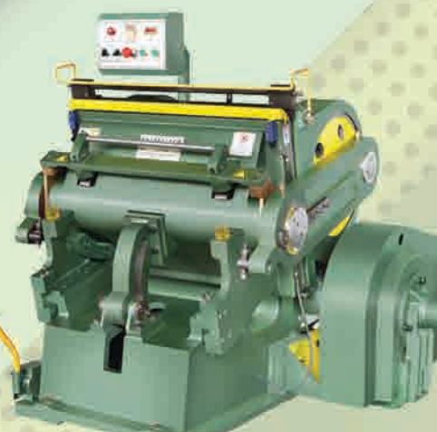
Mesin Pond / Diecut