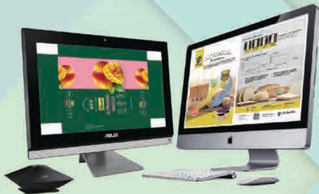
DESAIN & PRE PRESS (LAYOUT) Dengan Komputer High Tech untuk Percetakan

DESAIN / SETTING LAY-OUT / CTP / PRE PRESS / DIGITAL PROOF