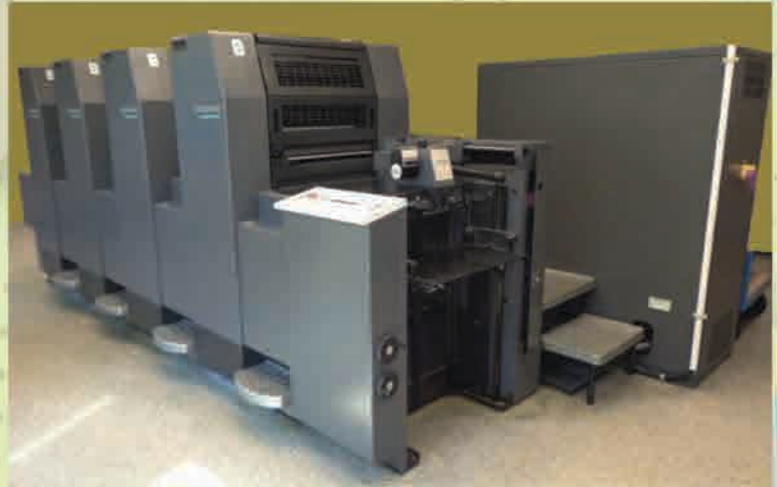
Mesin Cetak Offset Heidelberg SM 52